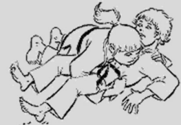
Yoko Shiho Gatame Contrôle des 4 points par le côté

Se placer derrière son partenaire (côté tête, sur les genoux). Placer vos bras sous ses bras et tenir la ceinture. Garder le contact.