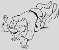
Tate Shiho Gatame Contrôle des 4 points à cheval

Passer son bras au-dessus du visage de son partenaire. Passer la main sous la nuque de son partenaire. Garder le contact.