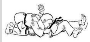
Kami Shiho Gatame Contrôle des 2 points par-dessus

Passer son bras au-dessus du visage de son partenaire. Passer la main sous la nuque de son partenaire. Garder le contact.